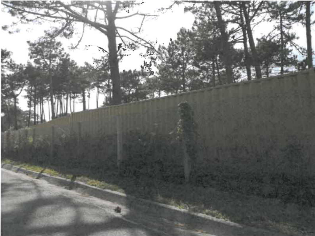
Imagens 1 a 10- Fonte: Setor de Fiscalização