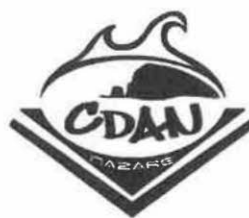
CLUBE DE DESPORTOS ALTERNATIVOS DA NAZARÉ