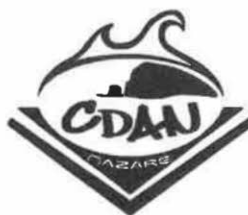
CLUBE DE DESPORTOS ALTERNATIVOS DA NAZARÉ